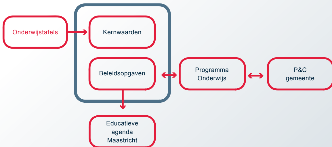
Afbeelding 2 Onderwijsvisie

Hoofdstuk 3 van deze visie is een matrix op basis waarvan de vijf gezamenlijke kernwaarden (op basis van het onderwijsnarratief in de bijlage) en beleidsopgaven in samenhang zijn geduid.