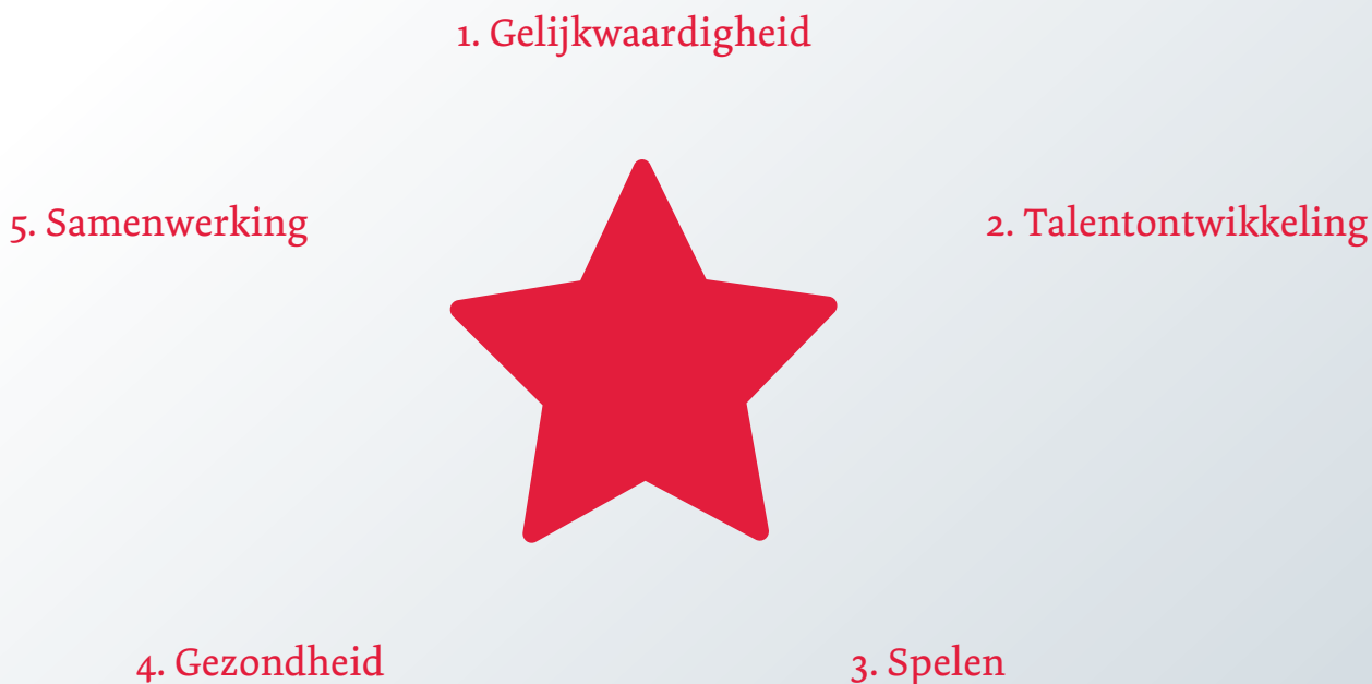
Afbeelding 1 De vijf sterwaarden

In dit verhaal zijn met behulp van de Maastrichtse ster vijf gezamenlijke kernwaarden geformuleerd. De onderwijs narratief is opgenomen als bijlage.